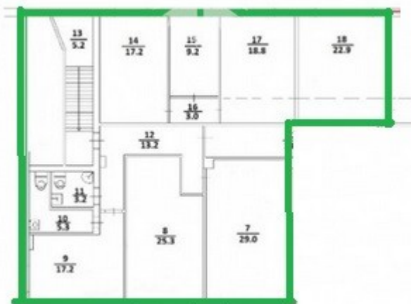
Блок 3 - 187,9 кв.м.