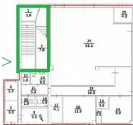
Блок 3 - 187,9 кв.м.