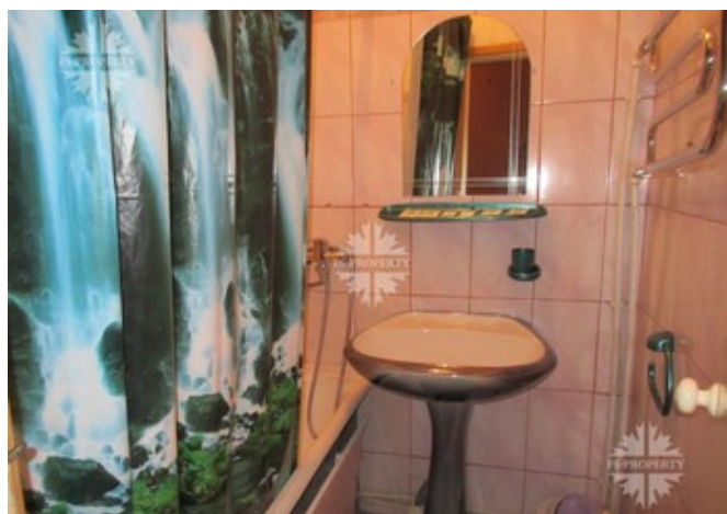
1 этаж ул. 1812 Года д6А стр.2